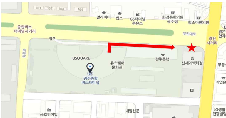
<1차 집결 장소 이미지 및 지도>