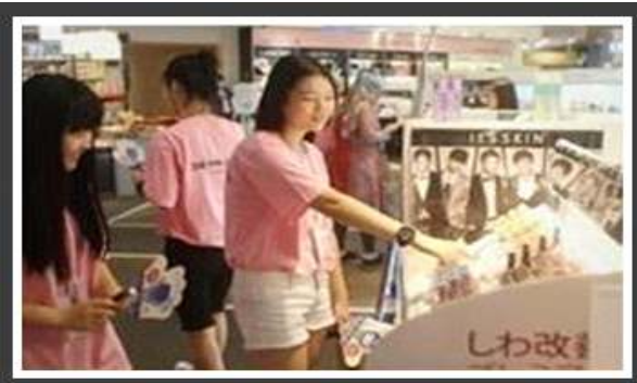
<동대문 도매시장 체험>