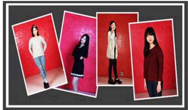
<사진 촬영 실무>