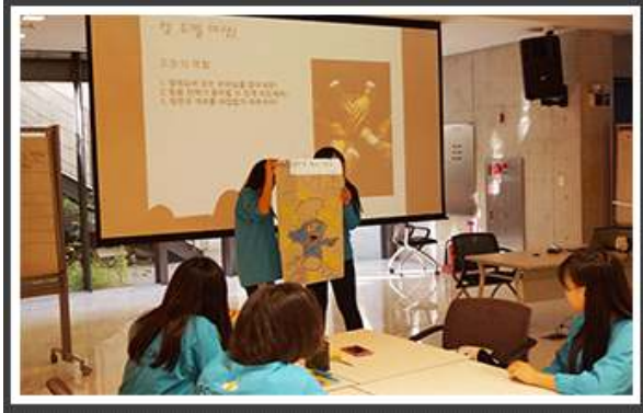
< 팀빌딩 >